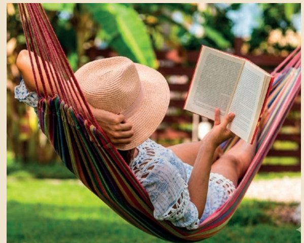
Se reposer