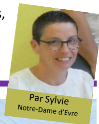
Par Sylvie Notre-Dame d'Evre