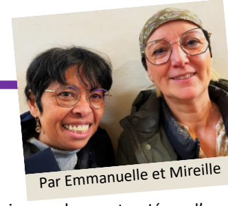
Par Emmanuelle et Mireille