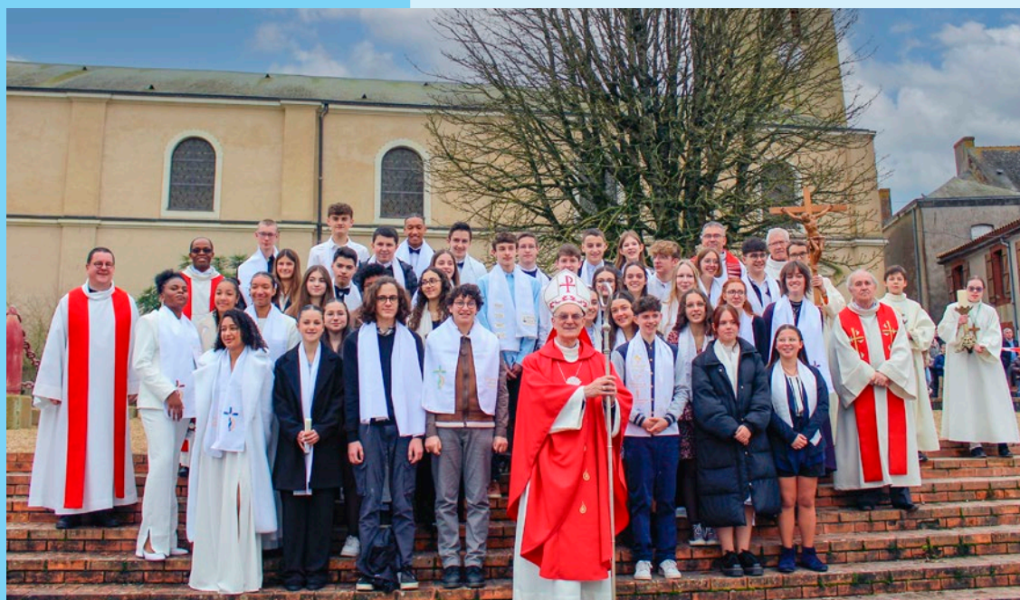
Jeunes confirmés à Saint-Pierre-Montlimart