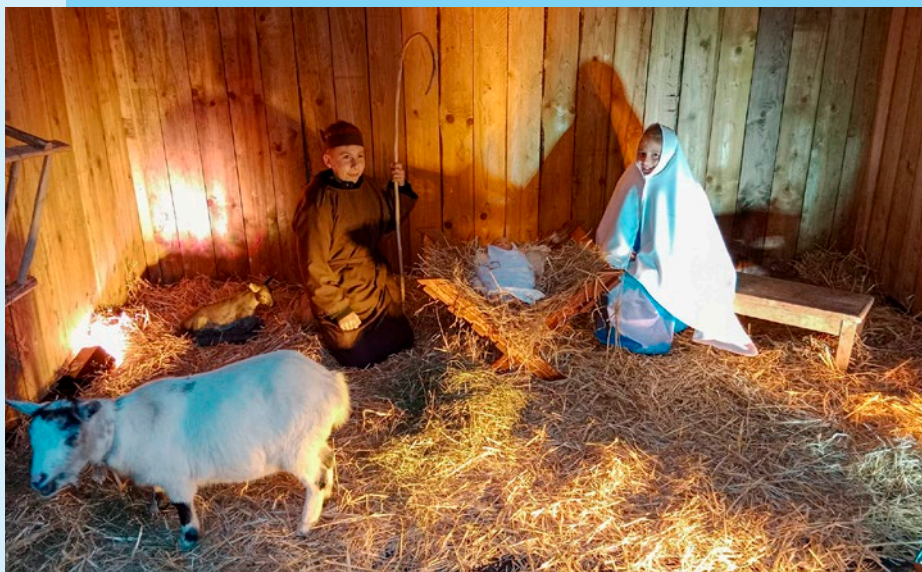
Crèche au Marché de Noël