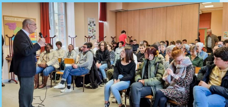
Rencontre avec Mgr MERCIER