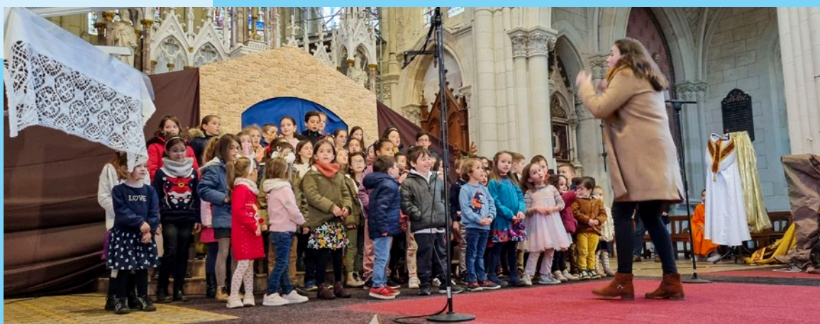
Chorale des primaires