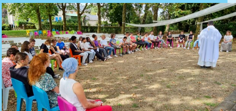
Confirmands à Béhuard