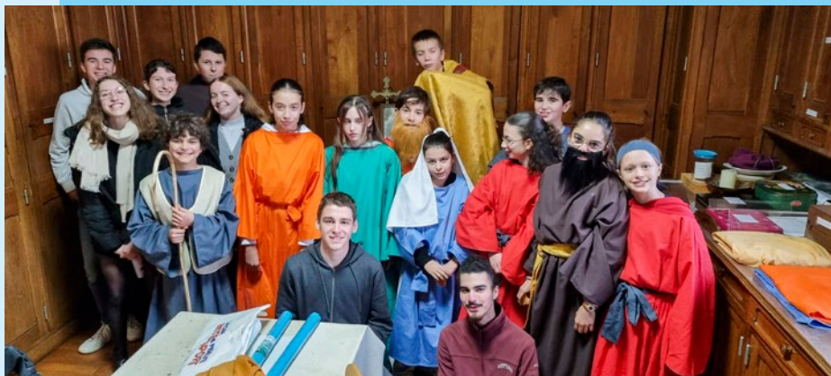
Groupe Conte de Noël