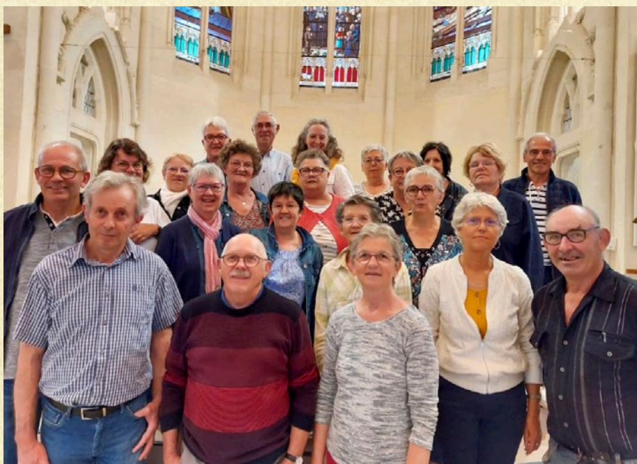
L'équipe coordinatrice des activités à l'église du Fief Sauvin

Dans nos communes, les églises ne sont pas utilisées uniquement pour les messes du dimanche. Elles sont des lieux de rassemblement qui accueillent bien au-delà des simples pratiquants de la messe. Lors des baptêmes, des célébrations des écoles, des mariages, des sépultures, des concerts, des visites, chaque personne est la bienvenue et respectée dans ses convictions. Les paroissiens se mobilisent pour que les célébrations soient belles et chaleureuses.