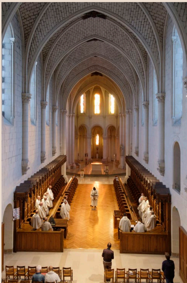
Abbatiale de Bellefontaine