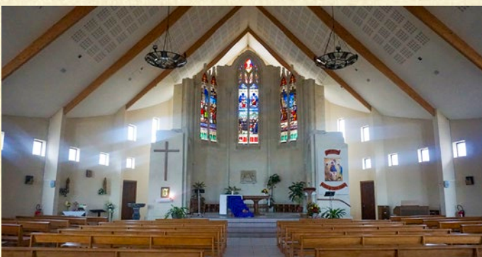
Intérieur de l'église du Fief-Sauvin

Le conseil municipal de l'époque ayant pris le dossier à bras-le-corps, après consultation de la population, a décidé en 1996, une restructuration lourde de l'église. Cette restructuration a consisté en une déconstruction partielle de l'ancienne église, tout en sauvegardant les vitraux du chœur.