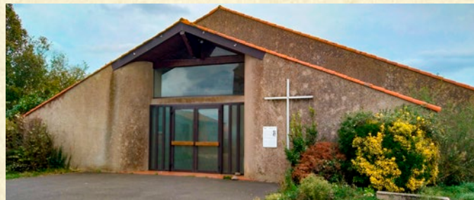
Église de Villeneuve

Le jeudi 13 décembre 1979, le bourg de Villeneuve a subi une tornade impressionnante détruisant tout sur son passage, décapitant les toitures des habitations et bâtiments. L'église de Villeneuve est prise dans cette tourmente, seuls le clocher et les murs étant épargnés. « Il n'y a plus de Villeneuve » se lamentaient les villageois. Aujourd'hui encore, les souvenirs de ce désastre restent encore très présents chez les habitants.