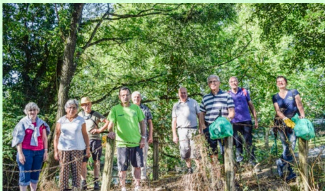
Équipe de lancement

Dès la reprise des réunions, l'équipe propose des vidéos qu'elle trouve sur le site des frères dominicains : cela s'appelle Théodom . Elles servent de support aux rencontres « réflexion/partage ». La première thématique, lors du Carême (dimanche 7 mars 2021) portait sur « Jésus était-il écolo ? ». Ces petits moments Théodom ont lieu une fois par saison (c'est l'idée) juste avant la messe et durent environ une heure. C'est un temps de partage et de méditation collective.