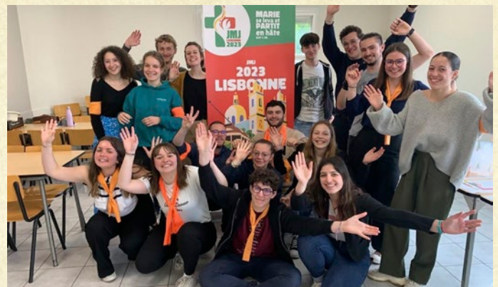
Quelques-uns des JMistes au concours de belote du 26 avril 2023

36 jeunes du doyenné des Mauges se préparent à partir aux Journées Mondiales de la Jeunesse: du 24 juillet au 9 août pour certains et pour d'autres du 31 juillet au 9 août. Cette année, le thème des J.M.J. est tiré d'une phrase de l'Évangile de saint Luc: « Marie se leva et partit en hâte ». Cette citation, choisie par le Pape, ouvre le récit de la Visitation. Dans cet évangile, le geste de se lever, pour rendre visite à sa cousine, présente Marie à la fois comme une femme de charité et comme une femme missionnaire. Partir en hâte représente l'attitude décrite dans les indications du Pape François pour les J.M.J. Lisbonne 2023: « que l'évangélisation des jeunes soit active et missionnaire, car c'est ainsi qu'ils reconnaîtront et témoigneront de la présence du Christ vivant ». Lors de ces journées, de nombreux temps forts permettront à tous d'approfondir sa foi: témoignages, messe, temps de louange, sacrement de réconciliation, veillée de prière... autant de moments forts pour aller à la rencontre du Christ!